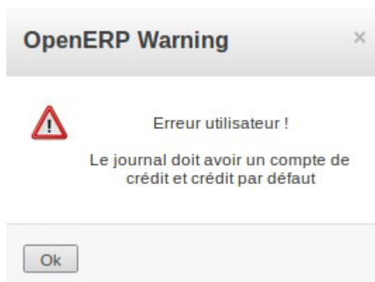
Fig. 4 - erreur journal d'ouverture

Si c'est la première fois que vous réalisez cette opération, un message d'erreur apparaît :