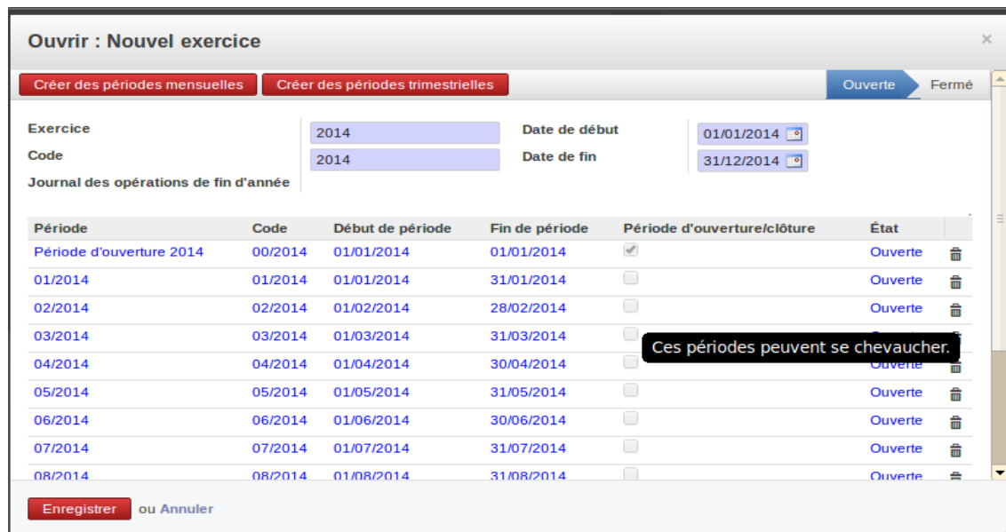
Fig. 2 - Créer le nouvel exercice et les périodes comptables

Le nouvel exercice n'existe pas, nous choisissons donc « créer et modifier » dans le champ Nouvel exercice