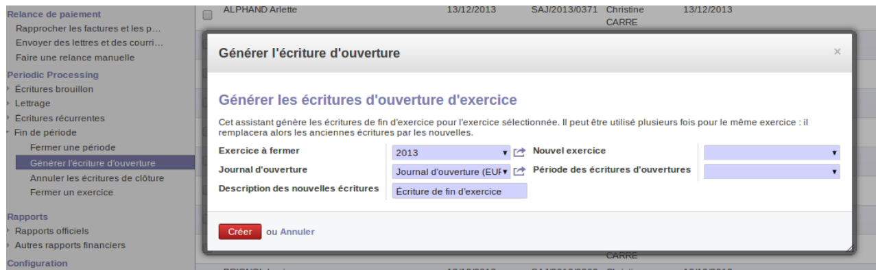
Fig. 1 - Exercice à fermer

Depuis l'écran qui nous permet de créer le nouvel exercice 2014, nous allons pouvoir clôturer l'année 2013